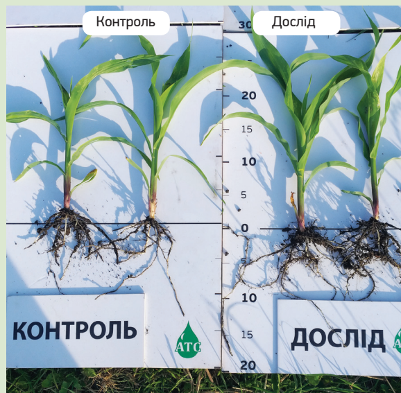
За рахунок фульвових кислот можна побачити більшу вегетативну масу.