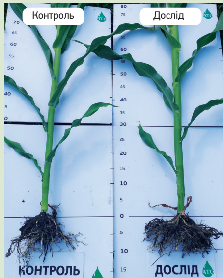
На фото візуально помітно більш розвинену кореневу систему у рослин на дослідній ділянці. Це стимулює краще засвоєння елементів живлення.